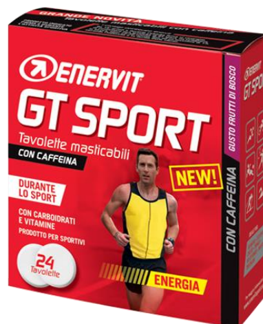
Enervit GT sport, příchuť lesní ovoce + kofein NOVINKA

Energetické tablety ENERVIT GT SPORT jsou připravené tak, abyste je mohli mít vždy u sebe k okamžitému použití. Mají vysoký obsah více druhů sacharidů pro rychlé zažehnutí nastupující únavy i pro průběžné doplňování energie.