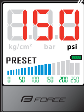
Obrázek "e" / Picture "e"