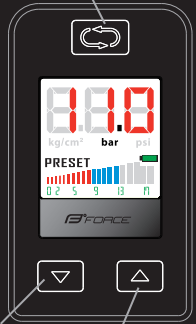
Tlačítko C / Button C